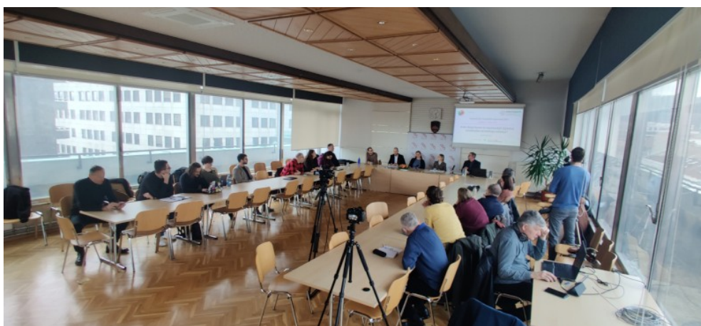
Dogodek ob svetovnem dnevu nevladnih organizacij 2025 » Kako dolgo bomo še zapostavljali digitalno preobrazbo nevladnega sektorja? « v sodelovanju z Mrežo NVO-VID (27. februar 2025). Zajem zaslona: Društvo Duh časa.

8.1.5 Novinarska konferenca » Kako vključujoča in uspešna je država Slovenija pri oblikovanju in doseganju digitalnih ciljev Evropske unije? «. Ljubljana (5. november 2025). Dostop https://www.inepa.si/2025/11/06/omejen-napredek-slovenije-in-izzivi-vkljucevanja-javnosti-pri-doseganju-digitalnih-ciljev-eu/ .