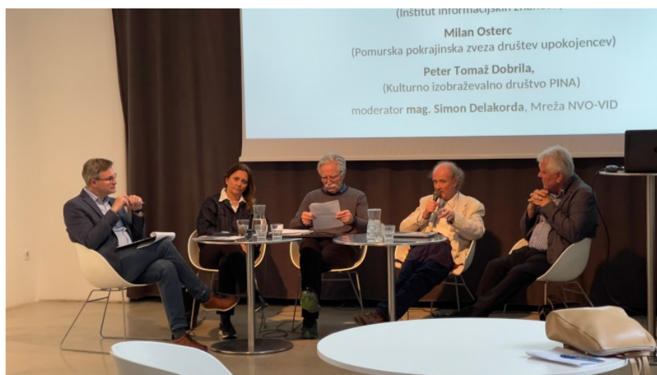
Moderiranje okrogle mize »Digitalni humanizem v ukrepih digitalne preobrazbe Slovenije: izgubljen v računalniških algoritmih?« na 11. Dnevu vključujoče informacijske družbe, Maribor (15. maj 2025).