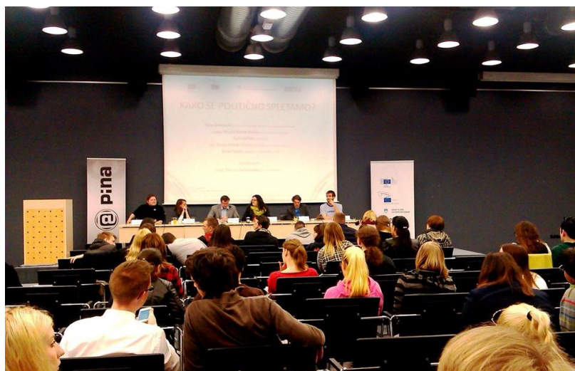
Moderiranje javne razprave "Kako se politično spletaemo?", konferenca EU SI TI 4. april Ljubljana