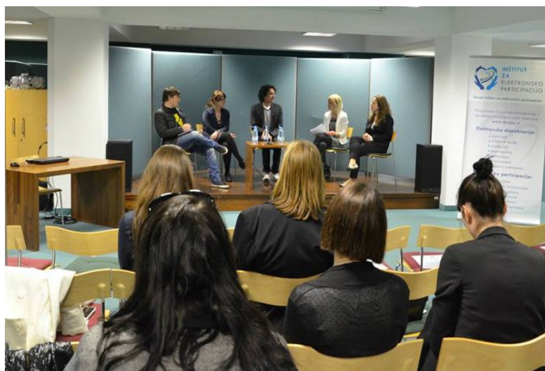
Predstavitve rezultatov regionalne raziskave in razprava "Mladi in mediji" (Ljubljana, 10. april 2014).

V letu 2014 je Inštitut za elektronsko participacijo vzpostavil in koordiniral nacionalno vsebinsko Mrežo nevladnih organizacij za vključujočo informacijsko družbo, okrepil strokovno-raziskovalno delo, zagovorniške aktivnosti ter povečal število javnih dogodkov v lastni organizaciji. Del projektne aktivnosti inštituta se je nanašal tudi na področje e-participacije na ravni Evropske unije. Na organizacijski ravni je inštitut nadaljeval z notranjo racionalizacijo dela in izboljšanjem finančnega poslovanja s povečanim obsegom prihodkov. Inštitut je okrepil svojo prisotnost na družbenih omrežjih ter ohranil obseg pojavljanja v množičnih medijih.