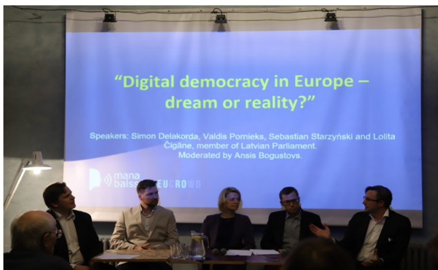
Udeležba na okrogli mizi »Digital democracy in Europe – dream or reality?« (Riga, Latvija, 23. november 2017). Projekt European Citizens Crowdsourcing.