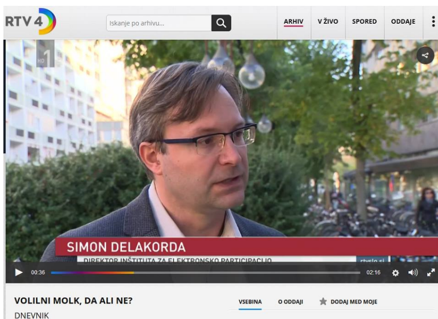
Izjava za TVSLO1 Dnevnik Volilni molk, da ali ne? , 21. oktober 2017.