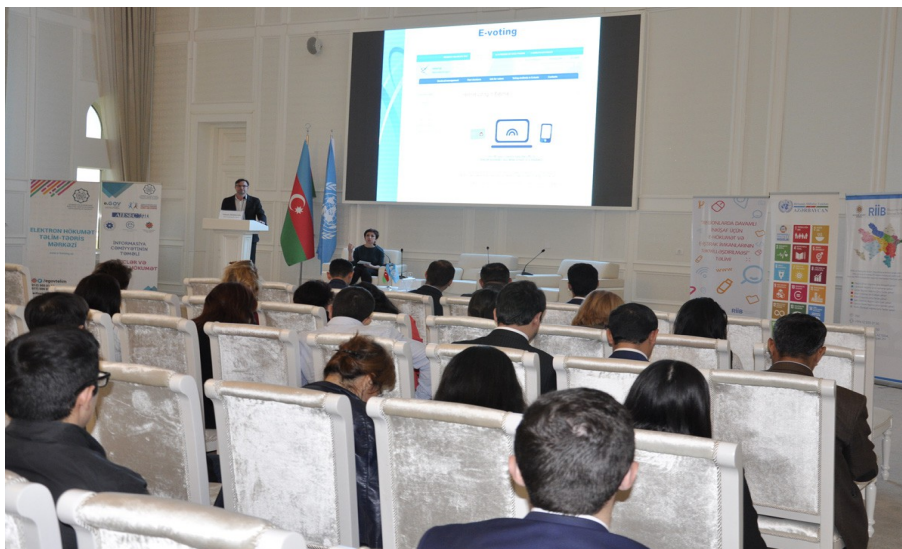
Izvedba delavnice »E-participation within e-government« v okviru usposabljanja »Improving E-Government and E-Participation Capabilities for Sustainable Development in Regions« (Ganja, Azerbajdžan, 3. november 2017).