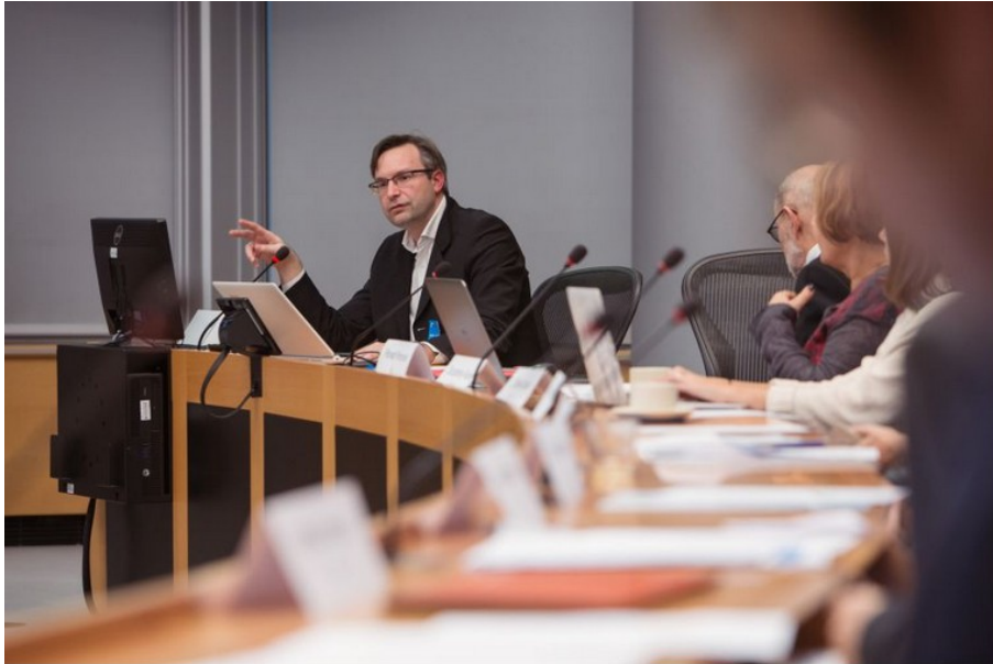
Predstavitev »eDemocracy practices in Slovenia: a quest for governance impact through an online deliberation«. Mednarodni dogodek »eDemocracy and eParticipation in Europe. The way forward?« (Evropski parlament, 28. november 2017).