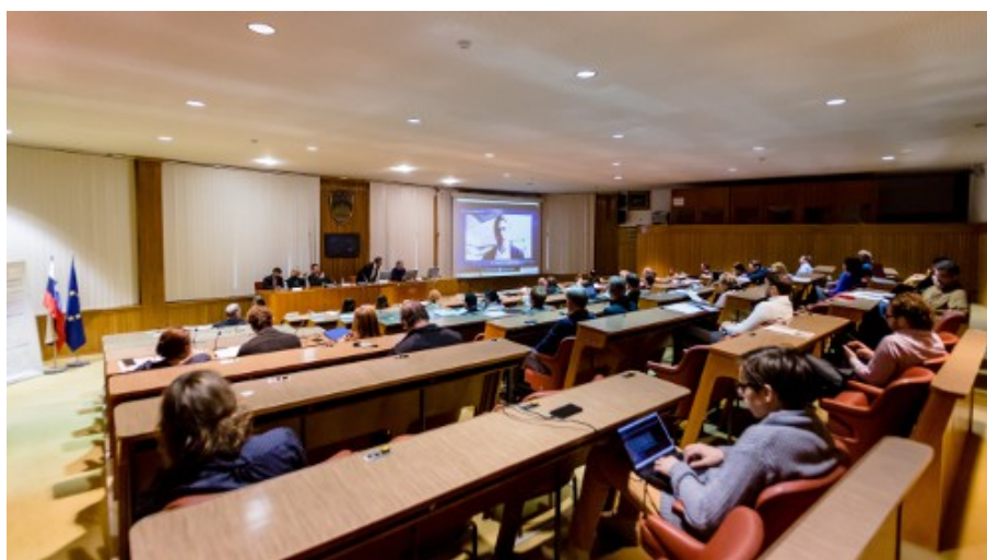
Organizacija javnega posveta »E-sodelovanje prebivalcev pri odločanju v slovenskih občinah – priložnosti in izzivi lokalne digitalne demokracije?« (Državni svet Republike Slovenije, Ljubljana, 10. november 2017). Projekt Popularizacija digitalne demokracije v Kranju in Velenju.

3.2.3 Dvoletni projekt Digital Ecosystem for E-participation Linking Youth - DEEP-Linking Youth. Naročnik European Citizen Action Service - ECAS ( http://ecas.org/deep-linking-youth/ ). Inštitut za elektronsko participacijo je izvedel zunanjo evalvacijo z vidika doseganja načrtovanih ciljev projekta. Naročilo je vključevalo pripravo evalvacijskega načrta z ustreznimi indikatorji merjenja učinkov projekta in pripravo zaključnega evalvatorskega poročila s priporočili za nadaljnje aktivnosti. Cilj projekta je bil vzpostaviti digitalni ekosistem za e-participacijo mladih na primeru mobilnosti mladih. Vrednost naročila je znašala 7.500,00 evrov. Projekt zaključen v letu 2017.