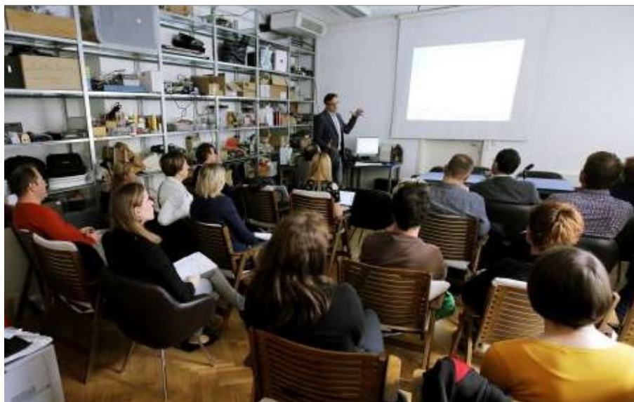
Organizacija Dneva vključujoče informacijske družbe v sodelovanju z Mrežo NVO za vključujočo informacijsko družbo (Ljubljana, 17. maj 2017).